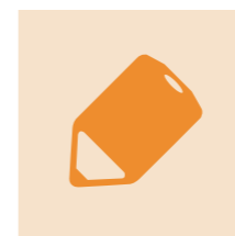
幼儿保育与教育课程