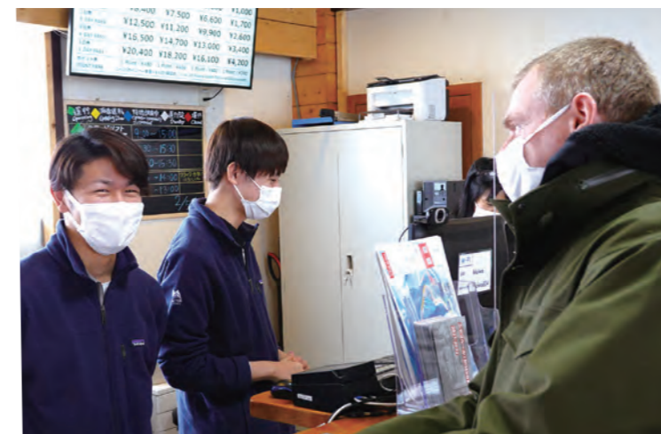
二世谷国际交流项目