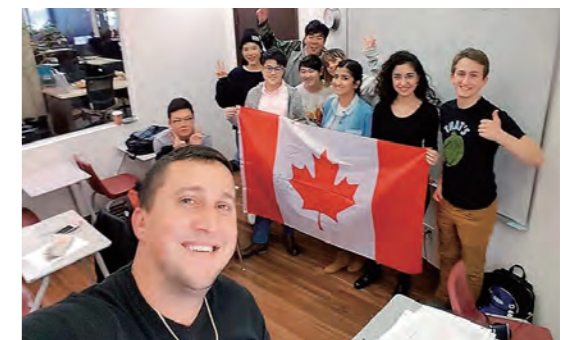
加拿大短期语言培训